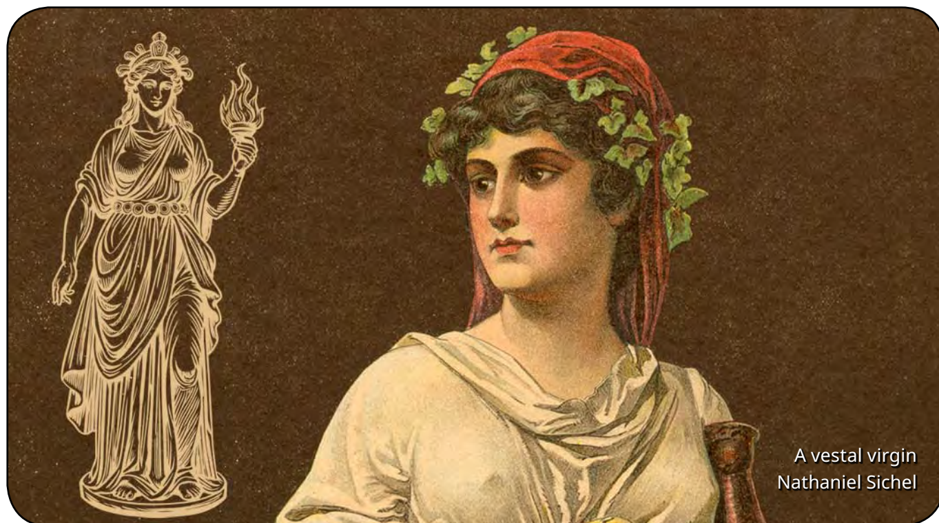
A vestal virgin Nathaniel Sichel

Každá žena v Římě byla kněžkou ve svém domě. Velkým ideálem však pro ni byly jiné kněžky, Vestálky, které pečovaly o státní Oheň ve Vestině chrámu, kde byly rovněž uloženy nejcennější dokumenty Říma, paladium a další posvátné symboly. Podle tradice tento Oheň ochraňoval celý Řím a dával mu sílu. Aby ho Vestálky dokázaly udržet stále hořící, musely vlastnit především pevnou morálku a čistotu v podobě bezúhonnosti. Po vzoru své bohyně musely zachovávat velkou čistotu těla, citů i myšlenek. Všechny ženy se mohly 9. června účastnit Vestálií, slavností bohyně Vesty, během nichž přicházely k chrámu a přinášely oběti v podobě koláčků ozdobených květinami jako symbolů toho nejlepšího a nejkrásnějšího, co nosily ve svém nitru.