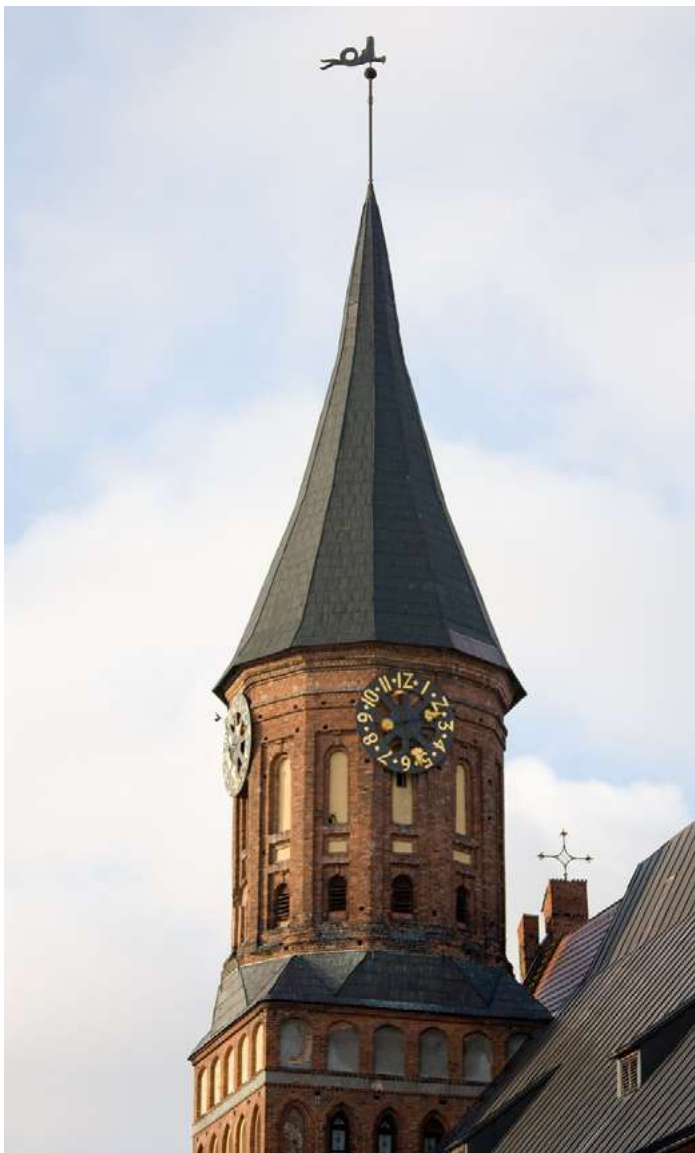
URNI STOLP V KALININGRADU

Ta zakon se izraža kot notranji glas vesti. Moralni zakon je kategorični imperativ, ki ni odvisen od osebnih interesov nas ali drugih, temveč od naše sposobnosti, da se vprašamo: "Ali želim, da se moj način delovanja vzpostavi kot univerzalni zakon za vse ljudi?"