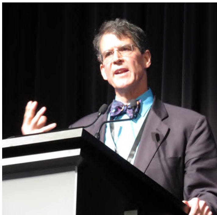
DR. EBEN ALEXANDER

"KAR SEM DOŽIVEL, JE BILO BOLJ RESNIČNO OD HIŠE, V KATERI SEM SEDEL, BOLJ RESNIČNO OD POLEN, KI GORIJO V KAMINU."