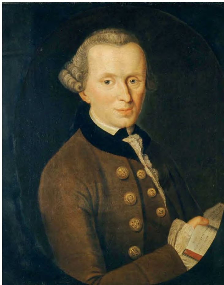
IMMANUEL KANT (1724–1804)

Kantovo osebno življenje je prepleteno z miti. Znano je, da je bil izredno discipliniran in natančen do te mere, da je dobil vzdevek 'Königsberška ura'. Vsak dan naj bi ob istem času