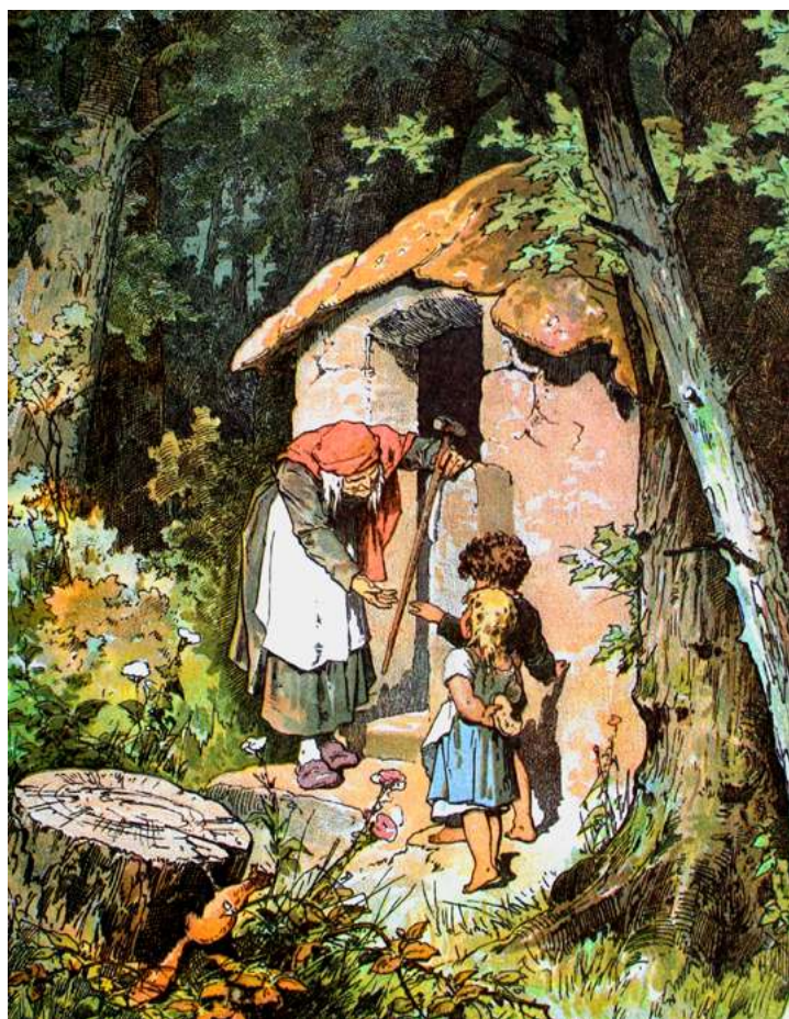
JANKO IN METKA

Pred več kot dvesto leti sta brata Grimm izdala prvi zvezek Grimmovih pravljic. Nista vedela, kako pomembno bo njuno delo in kako dolgo ga bodo cenili. Vsi smo odrasli ob pravljicah. Pravljice so vodniki, ki nam pokažejo nekaj vsesplošnega v človeški izkušnji. Povedo nam, da nismo sami, da so ljudje že šli skozi neko izkušnjo, katerakoli že to je.