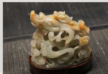
Nakit od žada, dinastija Juan ili rani Ming, Britanski muzej