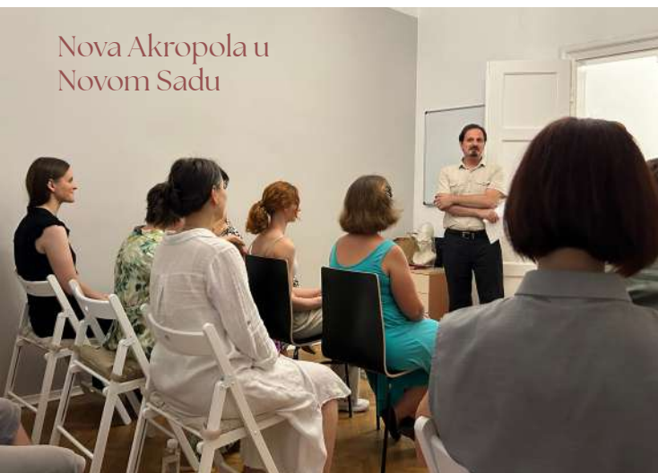
Nova Akropola u Novom Sadu

Otvorili smo sedište Nove Akropole u Novom Sadu. Možete nas naći na adresi: Sonje Marinković 12 (tel: 064 80 22 390, imejl: novisad@nova-akropola.rs).