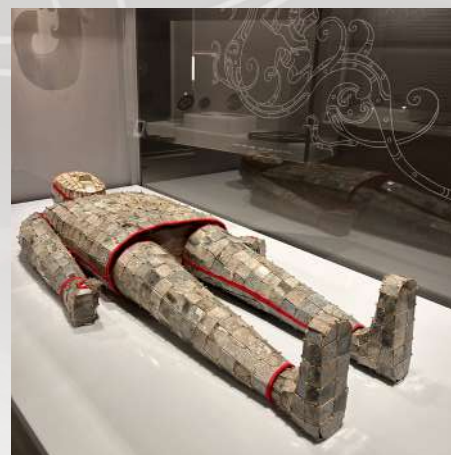
Pogrebno carevo odelo od žada, Han dinastija