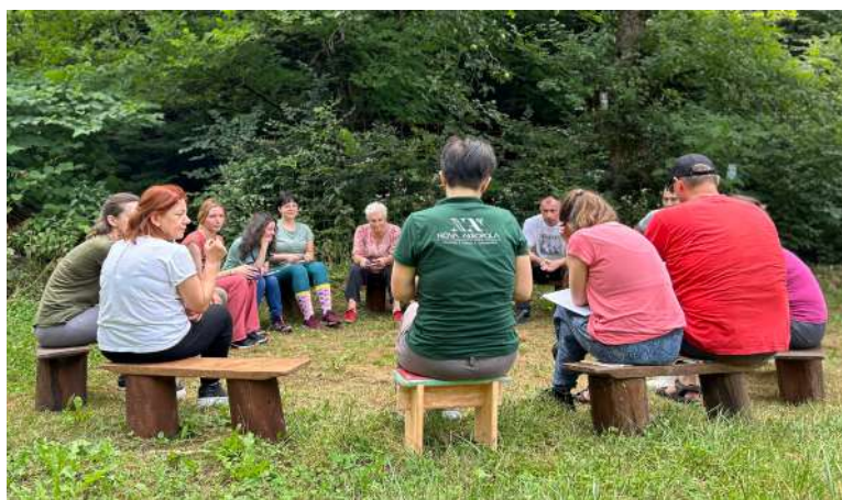
Letnji kurs filozofije