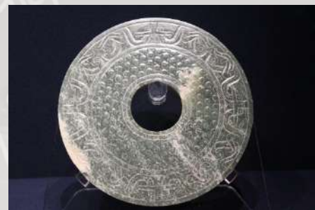
Bi disk od žada - Galerija žada Muzeja Šangaja.