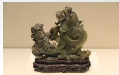
Rezbarije od žada iz Čing dinastije