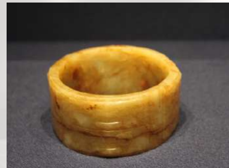
Kong od žada, Galerija žada Muzeja Šangaja

Ove vrline pokazuju smer koji ljudsko biće treba da sledi u životu. Kolika je superiornost moralnih i duhovnih vrednosti nad materijalnim blagom, najbolje pokazuje sledeća izreka: „Zlato je vredno, ali žad je neprocenjiv“.