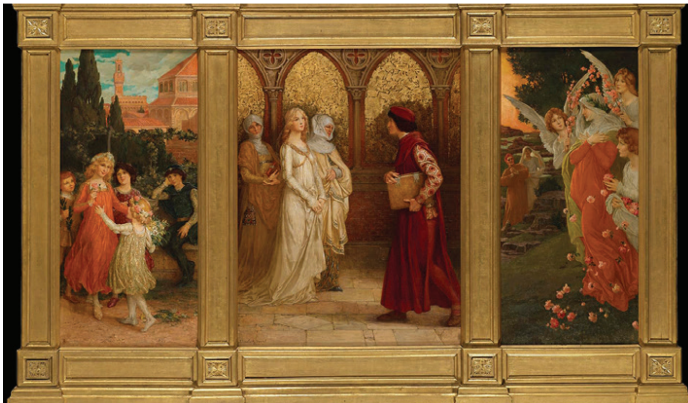
Сцени з La Vita Nuova, Елізабет Сонрель

У Земному Раю Данте зустрічається з небесною ідеальною Беатріче. Дрібничка ж тут зустрічає своє Дерево в його довершеній формі: «Там росло все листя, над яким він довго трудився, проте було воно радше таким, яким він його собі уявляв, аніж таким, як зміг намалювати». Споглядання цього Дерева для Парохія і, як ми потім дізнаємося, для багатьох інших стає «найкращою прелюдією до Гір» (аналогу Раю Небесного у Данте).