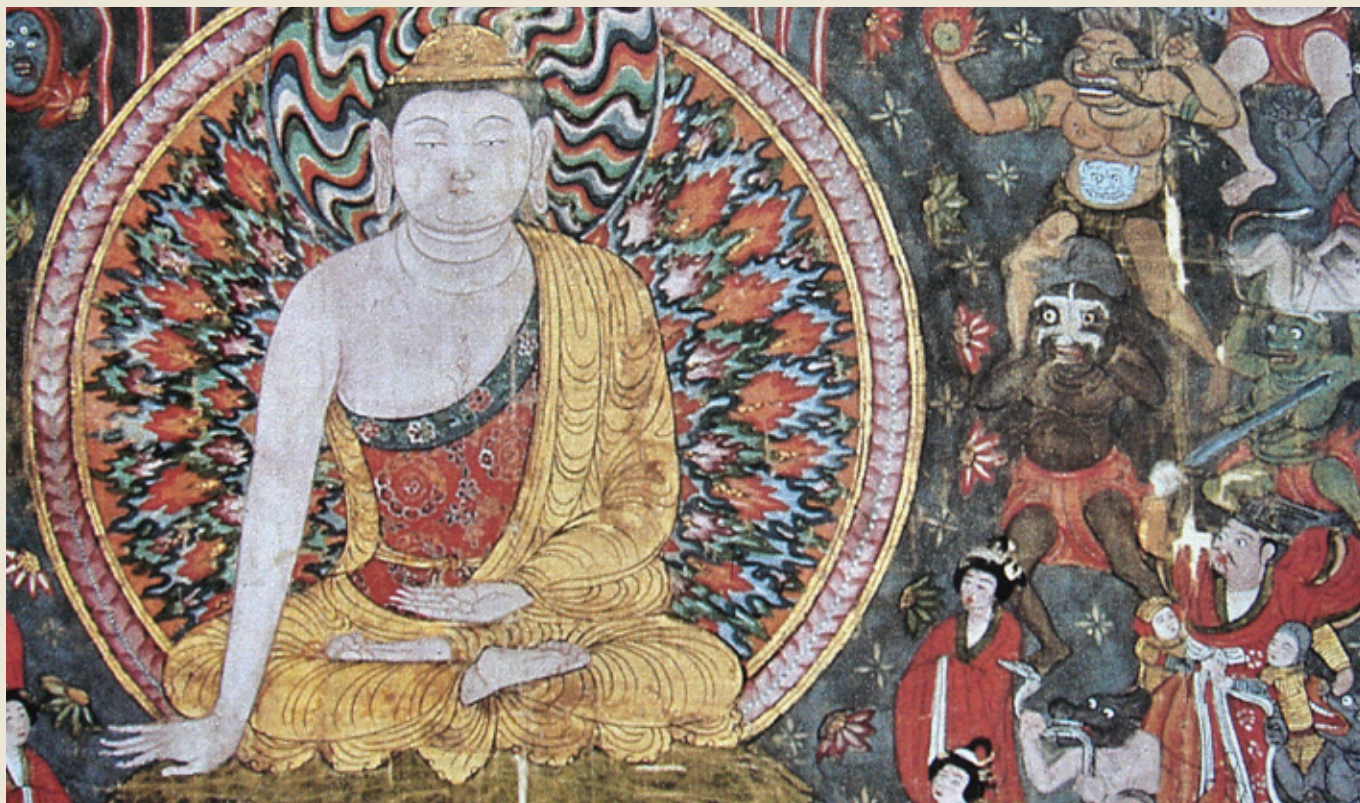
Мара випробовує Будду, деталь, поч. 10 ст.