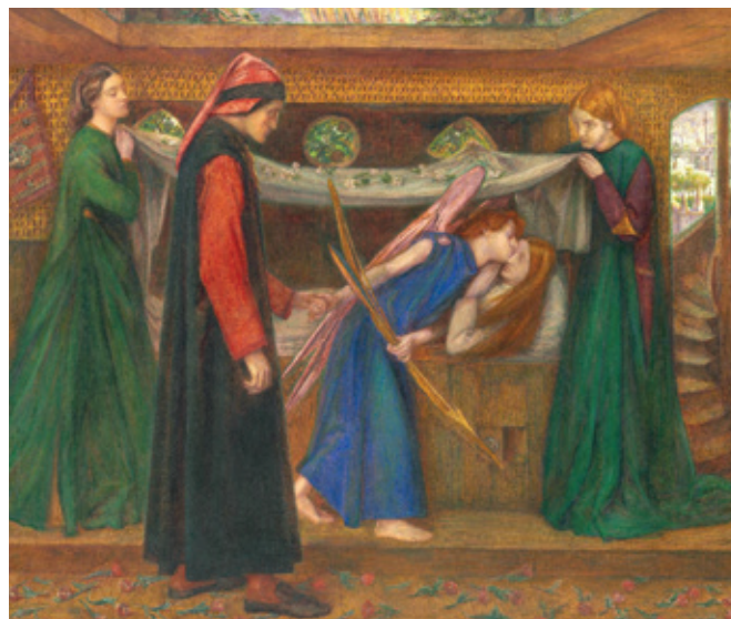
Сон Данте під час смерті Беатріче, Д. Г. Росетті, 1856

У випадку Данте таким поворотним моментом стає зустріч із Беатріче, описана в книзі «Нове Життя». Беатріче для Данте – «найдосяконаліше з усіх створінь». Вона стає центром його життя, навколо якого все зосереджено. Він сприймає її такою, «як вона є на небесах», безгрішною та ідеальною. Щоразу, коли Данте бачить її, вона запалює в ньому «вогонь милосердя»: він готовий прощати всіх, хто його образив. За Вільямсом, у ці моменти Данте сповнений «миттєвим вогнем чистої любові».