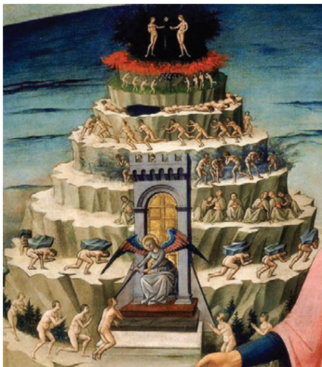
Гора Чистилища (деталь фрески), Доменіко ді Мікеліно, 1465

Проте Дрібничка відрізняється від Данте тим, що на початку зовсім не має досвіду «вогню милосердя». Толкін показує це через сусіда Дрібнички – Парохія. Сусід потребує допомоги – він кульгає на одну ногу і періодично просить Дрібничку про різні послуги. Той виконує їх, але з внутрішнім спротивом: «Коли чоловічок таки робив щось, добре серце не вберігало його від бурчання, люті й лайок (переважно собі під ніс)». Прохання сусіда Дрібничка вважав «перешкодами», бо вони відволікали його від цікавої справи – мистецтва і примушували займатися буденними речами.