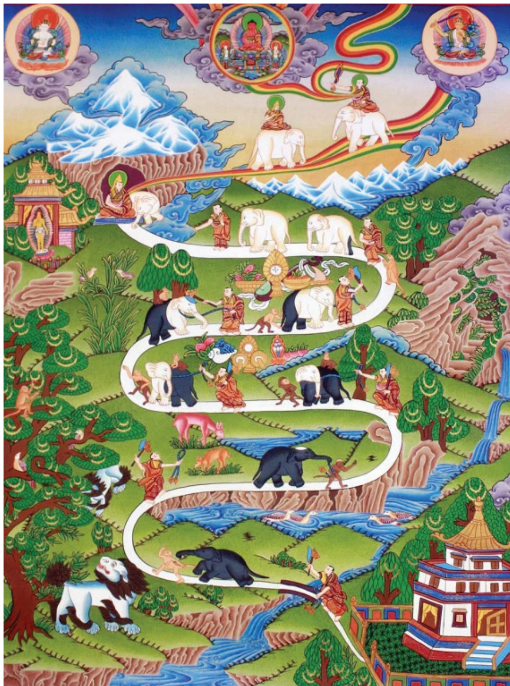
Дев'ять етапів ментального розвитку

Свідомість є центром. Але недосить знати те, що існує якийсь центр, що ми його споглядаємо іззовні, немов він нам не належить. Саме ця відчуженість від свого центру спричинює напругу та зусилля.