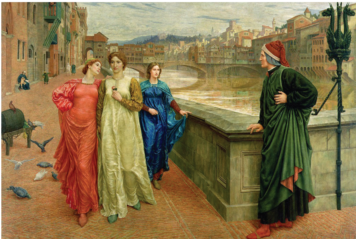
Данте зустрічає Беатріче. Генрі Голідей, 1883

Коли на містечко налітає буревій і пошкоджує дах будинку Парохія, Дрібничці під час дощу доводиться поїхати у місто за майстрами. Через цю поїздку він застуджується, а невдовзі до нього приходить Візник і оголошує, що настав час вирушати у Подорож. Картина залишається незавершеною, а Дрібничка опиняється в якомусь місці, яке нагадує йому чи то лікарню, чи то в'язницю. Там він довгий час важко фізично працює, а одного разу, лежачи в темряві, чує два Голоси, які обговорюють, як він жив до Подорожі і як відтоді змінився. Вони вирішують, що Дрібничка може перейти на наступний етап, тож він вирушає до краю зелених пагорбів, де раптом бачить велике Дерево, в якому незабаром впізнає втілення свого власного задуму: він опинився всередині своєї картини. Раптом Дрібничка розуміє, що для завершення картини йому потрібна допомога його колишнього сусіда Парохія, садівника. З'являється Парохій, і вони починають працювати разом. По закінченню Дрібничка вирішує слідувати за пастухом у гори, які слугували далеким тлом його картини, тоді як