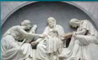
Mojre – Zeusove kćeri suđenice