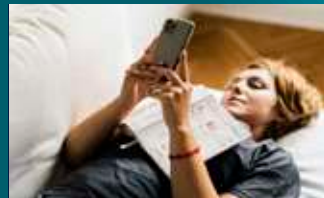
Pasivnost je bolest našeg vremena