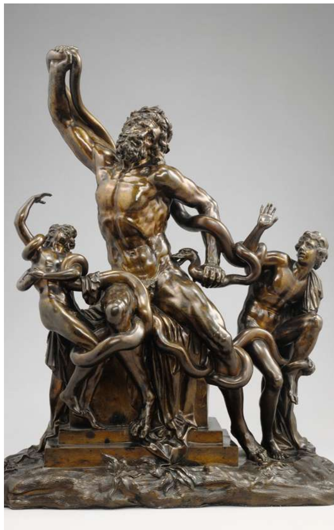
Laocöon Giovanni Battista Foggini (1652–1725) Foto: Getty Museum

În jurul secolului al XI-lea î.Hr. dorienii pătrund în Pelopones, influențând etnic, cultural și politic întregul teritoriu. Această mișcare de populație este cunoscută și ca venirea heraclizilor, deoarece cei trei conducători dorieni, Cresfonte, Temenos și Aristodemos, se considerau urmași direcți ai eroului Heracles. Tocmai datorită acestei descendențe ei susțineau că zona Peloponesului le-ar aparține de drept și astfel încep o campanie de cucerire a acestui teritoriu. Mai târziu, originile Spartei ajung să fie ancorate în descendența lui Heracles, care devine un fondator legendar și un model arhetipal al cetății războinice.