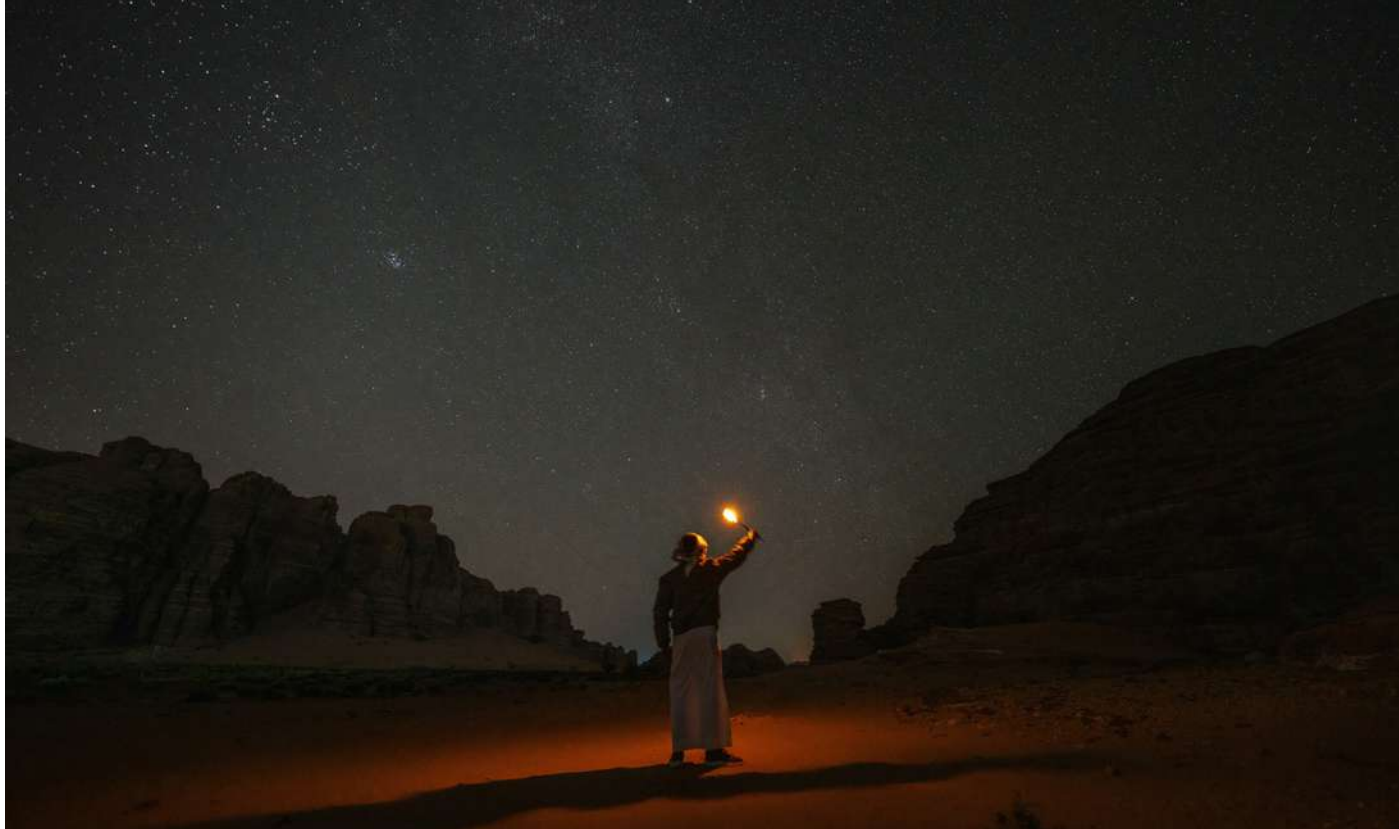
Omul în căutarea Adevărului

D e cele mai multe ori, întreprinderea de a readuce lumea vechilor greci în fața ochilor noștri poate fi îngreunată atât de vestigiile insuficiente pentru a le recompune lumea, dar și de puntea de mai mult de 2000 de ani care ne desparte. Însă, chiar dacă uneori este provocator să le percepi universul, iar cuțărul limbilor moderne pare nesatisfăcător când încercăm să traducem cuvinte și concepte din greaca veche, cred că această muncă arheologico-lingvistică își are o împlinire pe măsură.