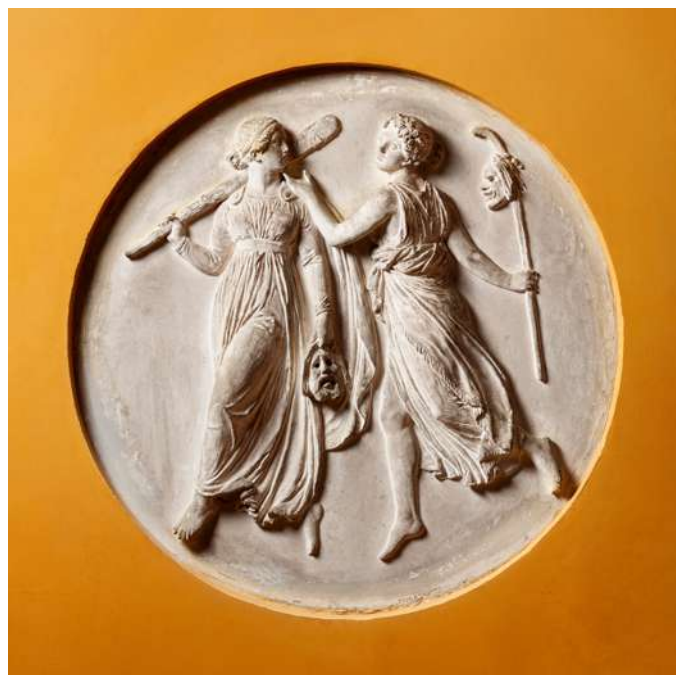
Muzele Tragediei și Comediei — Bertel Thorvaldsen Melpomene, cu masca tristă a tragediei Thalia, cu masca zâmbitoare a comediei Muzeul Thorvaldsens, Copenhaga, Danemarca

Merită notat că pentru grecii antici aceste dezbateri nu țineau de domeniul unor speculații abstracte, doar pur intelectuale, așa cum sunt văzute în modernitate, ci erau văzute ca fiind un stil de viață, într-un mod practic, pentru a-i ajuta în lunga lor căutare a cunoașterii. Pentru Antichitate, filosofia era în definitiv, așa cum numele o spune, dragoste de înțelepciune și este ceea ce și noi încercăm să atingem prin participarea la cursurile Noii Acropole, lectura cărților alese și acțiunile desfășurate în spirit filosofic, iar sensurile profunde pe care Alétheia și Enthousiasmós , Adevărul și Entuziasmul ni le oferă, ne ajută cu siguranță în periplul nostru. 📖