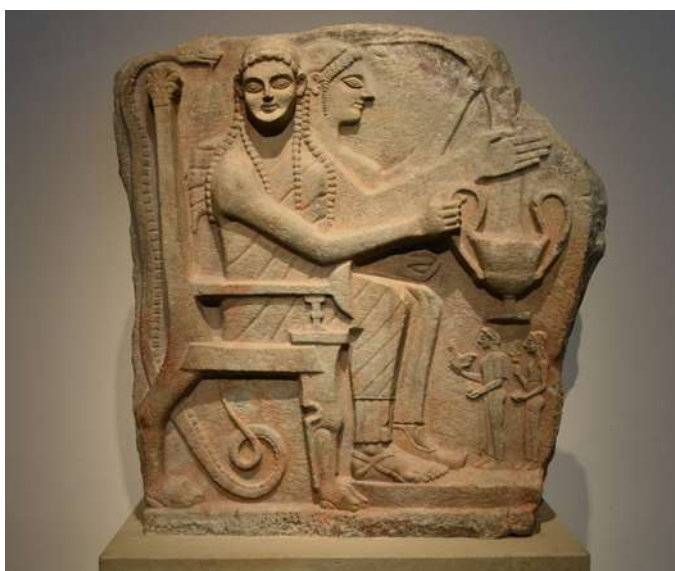
Relief cu eroi și închinători , Sparta, cca. 540 î.Hr.

Convițuirea bună a cetățenilor era un deziderat general. Astfel, erau create numeroase oportunități pentru socializare, împrietenire, cultivarea tovarășiei, dar și pentru rezolvarea disputelor care apăreau. În același timp, tot în spiritul curtoaziei, cetățenii erau încurajați să practice exprimarea sinceră, concisă și directă și să evite jocurile de cuvinte, subiectele incomode sau vorbirea ambiguă, fapt ce a condus la modul de a vorbi laconic, tipic spartan.