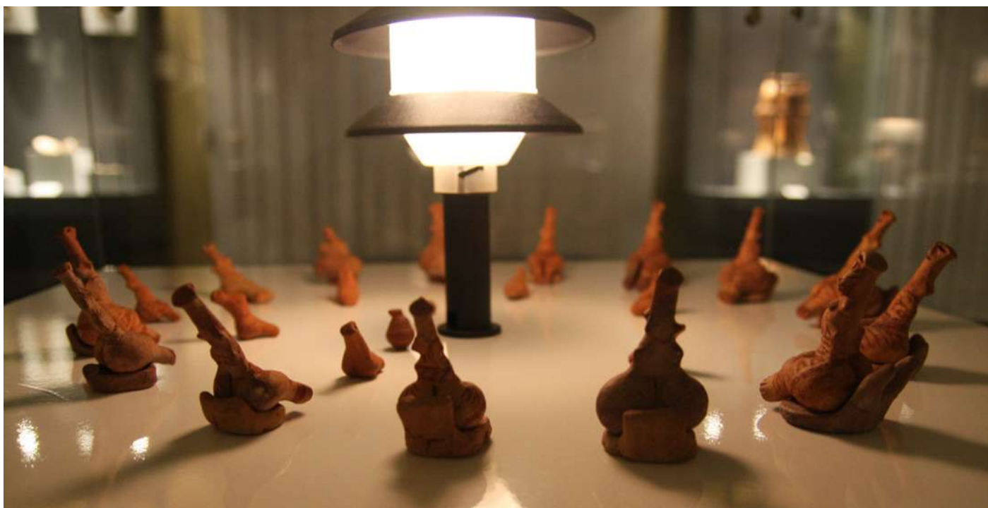
Figurine din lut România, datate 4900–4700 î.Hr.

lor de a se apropia de abstract, de valorile cele mai înalte posibile, de Divinitate. Pentru ei, aceste figurine erau reprezentarea Zeiței-Mamă care simboliza Protecția, Dragostea, originea primordială a Creației.