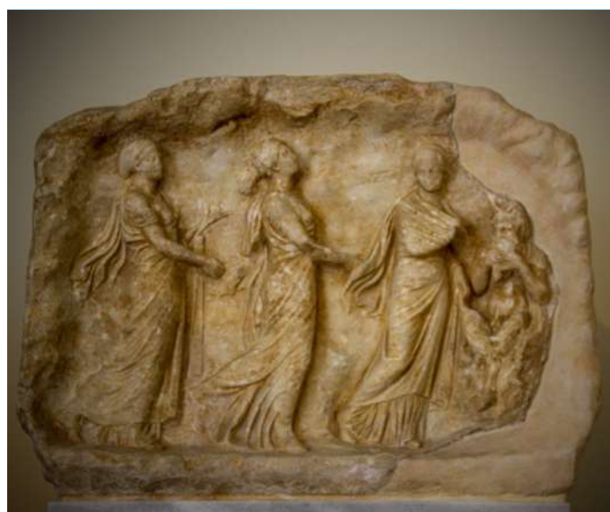
Basorelief votiv din marmură în formă de peșteră , cca. 325 î.Hr.

Valori spartane prin excelență și deziderate ale oricărui cetățean al Spartei, indiferent de sex sau vârstă. Curajul și onoarea aveau o importanță mult mai mare decât orice formă de avuție materială.