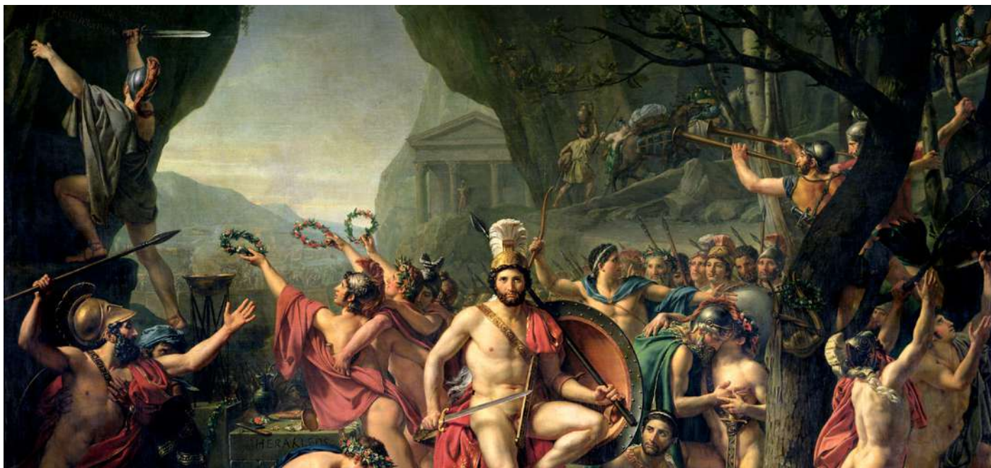
Leonida la Termopile Jacques-Louis David (1748–1825)

de la Termopile și după căderea inevitabilă a apărătorilor spartani, Gorgo, recunoscută pentru excelența virtuților sale spartane, a muncit neobosit în capitală, utilizând toate pârgurile politice pe care le avea la îndemână, pentru a obține sprijin militar care să vină în ajutor lui Leonida și trupelor sale, iar apoi pentru a uni mai multe cetăți grecești într-o coaliție care să țină piept Persiei.