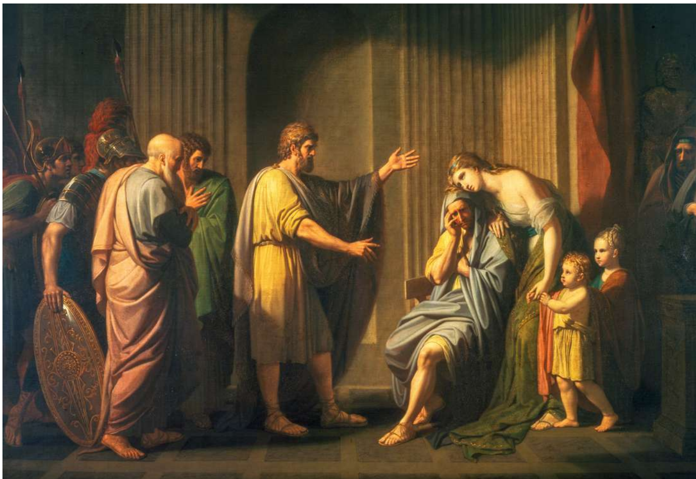
Cleombrotus exilat de Leonidas al II-lea, regele Spartei Benjamin West (1738–1820)