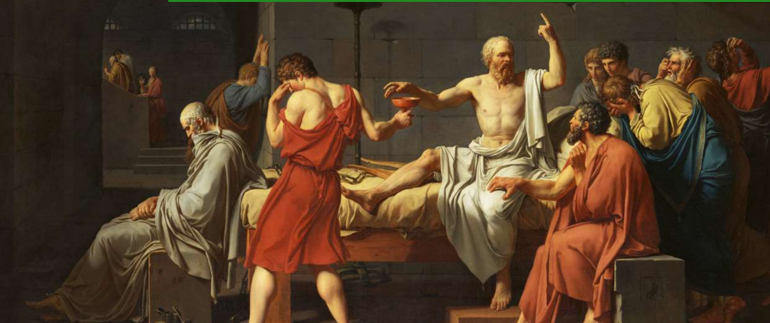
Moartea lui Socrate — Jacques-Louis David Muzeul Metropolitan de Artă, New York, S.U.A.