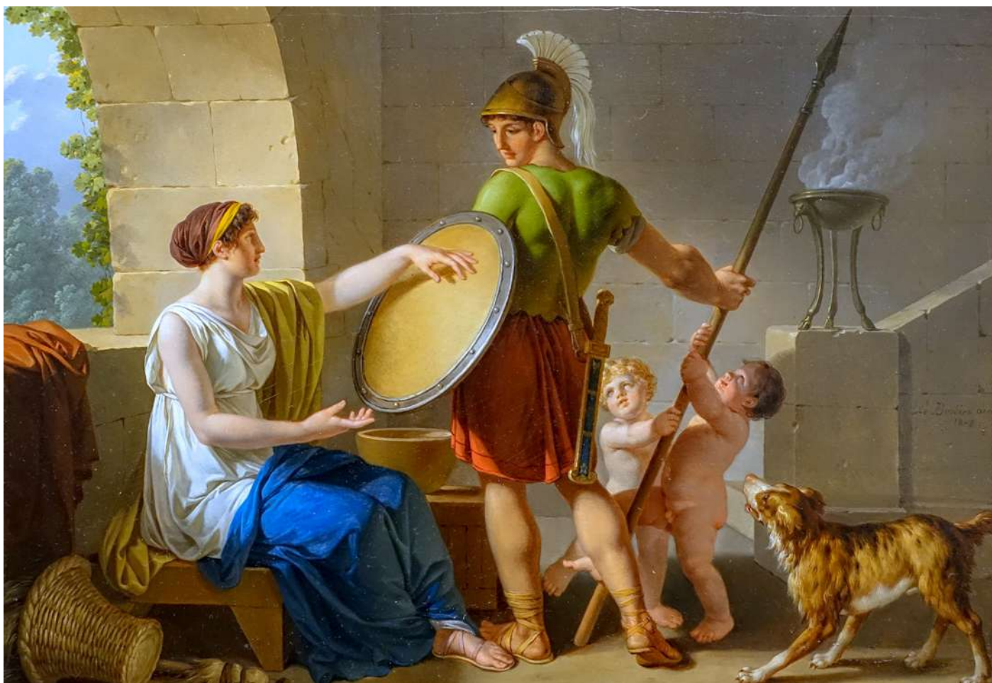
Femeie spartană dând un scut fiului ei Jean-Jacques-Francois Le Barbier (1738-1826)