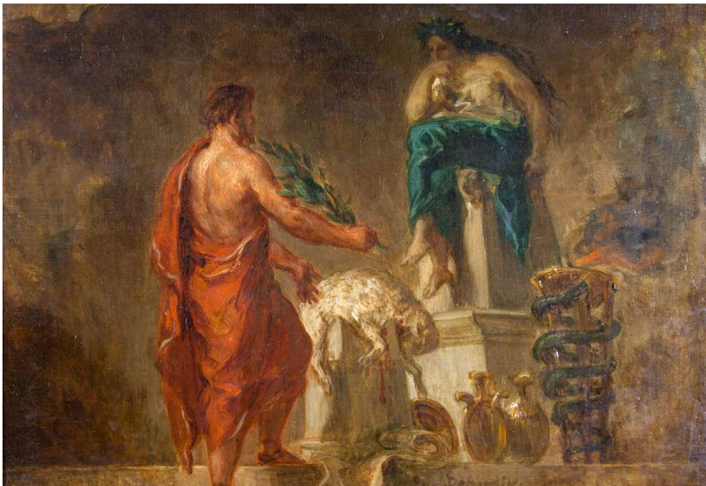
Licurg consultând-o pe Pythia Eugène Delacroix (1798–1863)