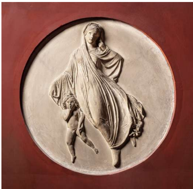
Mnemosyne și Harpocrates — Bertel Thorvaldsen Mnemosyne, mama celor nouă muze, alături de micuțul Harpocrate, zeul grecesc al tăcerii Muzeul Thorvaldsens, Copenhaga, Danemarca

Despre Léthe, apa uitării, vorbește și Platon în două din dialogurile sale, Philebos (63e) și Republica (X, 621a), înfățișând-o ca o câmpie cu un fluviu Ameles, „a cărui apă niciun vas nu o poate conține (...), cei care beau pierd orice amintire.” Același Platon ne oferă o altă interpretare etimologică a cuvântului pe care îl examinăm, Alétheia. În dialogul Kratylos (421b.), acesta, prin vocea lui Socrate, desparte termenul în două părți: alé , cu înțeles de „cursă”, de „alergare” și theia , cu sensul de „divină”. Reieșind din această interpretare că Alétheia poate fi și o „alergare divină”, cu siguranță către ceva . Putem extrage succint, din nuanța pe care o oferă Platon cuvântului, că ar exista o ascensiune a conștiinței umane, către forma sa ultimă, eternă, adevărată . Asemeni celui om din Mitul Peșterii care evadează pentru a vedea adevărata natură a lumii și nu umbrele dinăuntru.