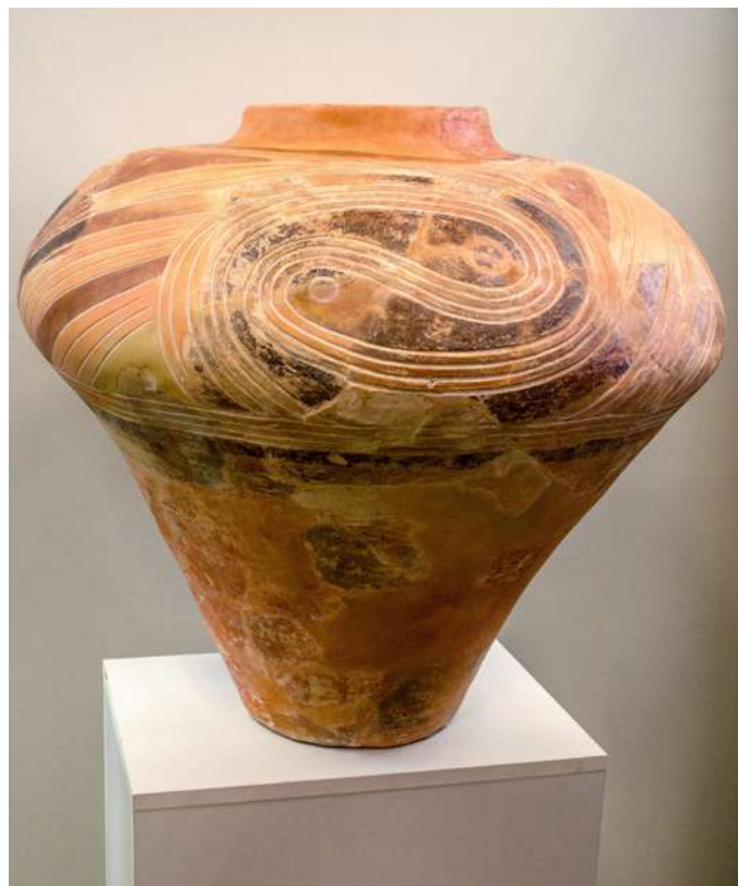
Vas din ceramică, perioada Cucuteni–Tripolie Muzeul Național de Istorie, Kiev, Ucraina

Legendarul oraș al Babilonului era zidit din cărămidă arsă la soare. Lutul alb s-a folosit încă din antichitate în China și continuă și azi, pretutindeni, să fie materia primă pentru fabricarea porțelanului, a faianței și a veselei de bucătărie. Iar argila expandată se utilizează astăzi ca strat de protecție sub planșeul încăperilor de la subsol, ca plastifiant în betoane, pentru umplerea spațiului în fundații, la ridicarea barajelor de pământ, a drumurilor, căilor ferate, canalelor etc. (2)