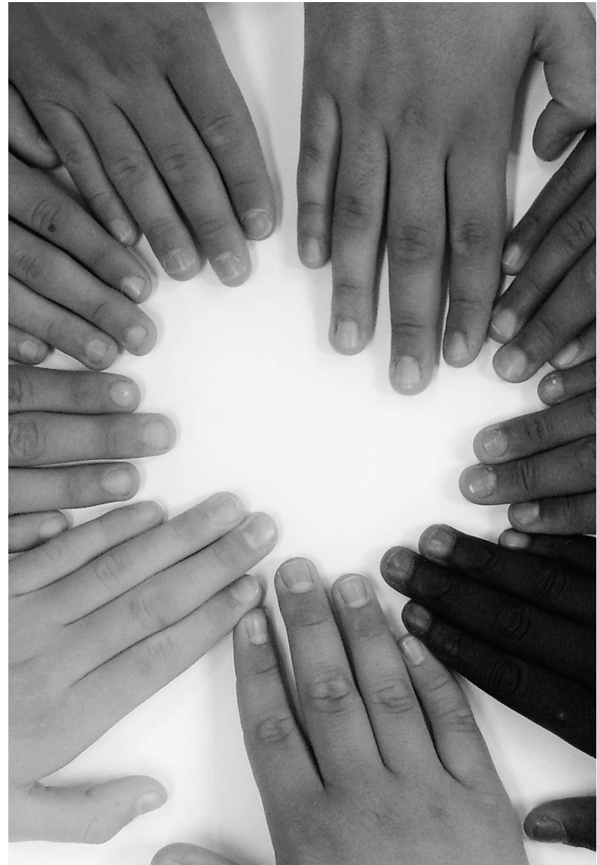
■ Imagen de Barbara Bonanno en Pixabay.

■ “No hay convivencia posible cuando falta la generosidad del amor y cuando prevalece el sentimiento absorbente del que se considera único en el mundo”.