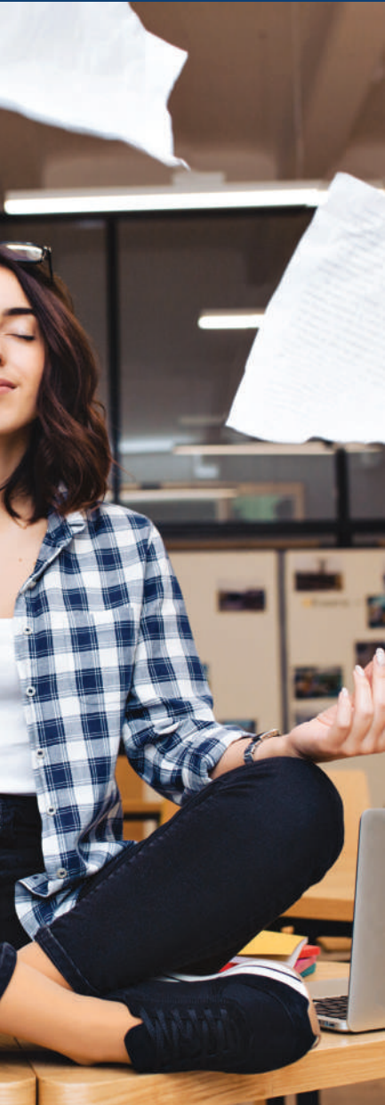
■ Imagen de LookStudio en Freepik.

Aceptar estas imperfecciones no permitiéndoles que destrocen nuestros sentidos. Pero limar, poco a poco, estas imperfecciones empezando por nosotros mismos, y siguiendo luego por las cosas que amamos.