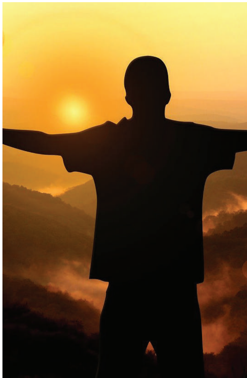
■ Imagen de Gerd Altmann en Pixabay.

■ Nueva Acrópolis Guatemala Biblioteca Virtual Publicado el 11-02-2016