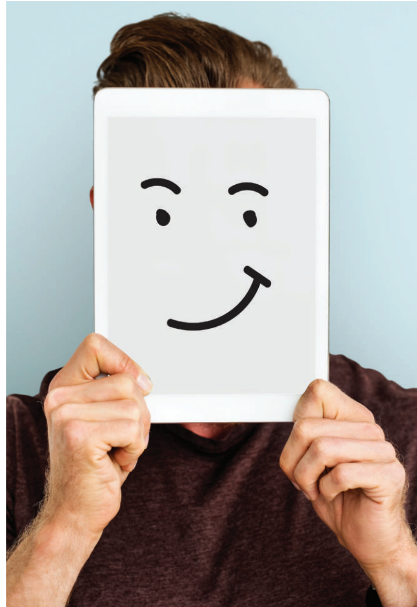
■ Imagen de RawPixel en Freepik.

■ “Si hemos aprendido en el plano físico que todos los objetos requieren un mantenimiento para subsistir, ¿cómo no habían de requerir mantenimiento los sentimientos para perdurar?”.