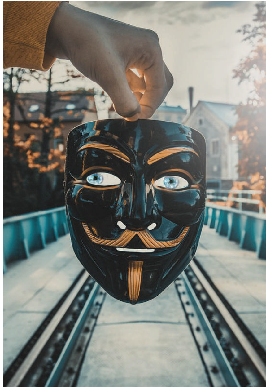
■ Imagen de Vojtěch Kučera en Pixabay.

■ “La que más duele no es la mentira que se advierte, sino la que engaña subrepticamente”.