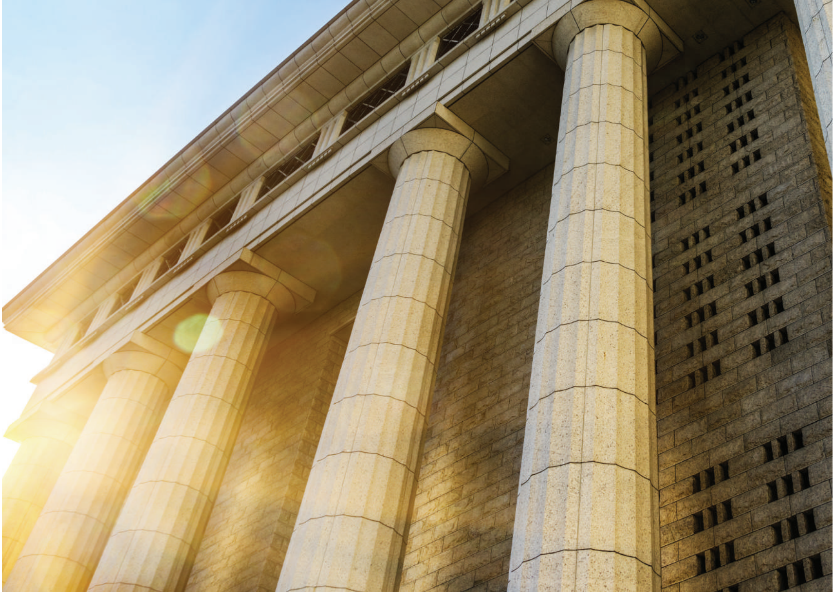
■ Imagen de Fanjianhua en Freepik.