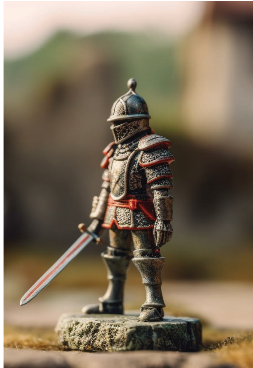
■ Imagen de Freepik.