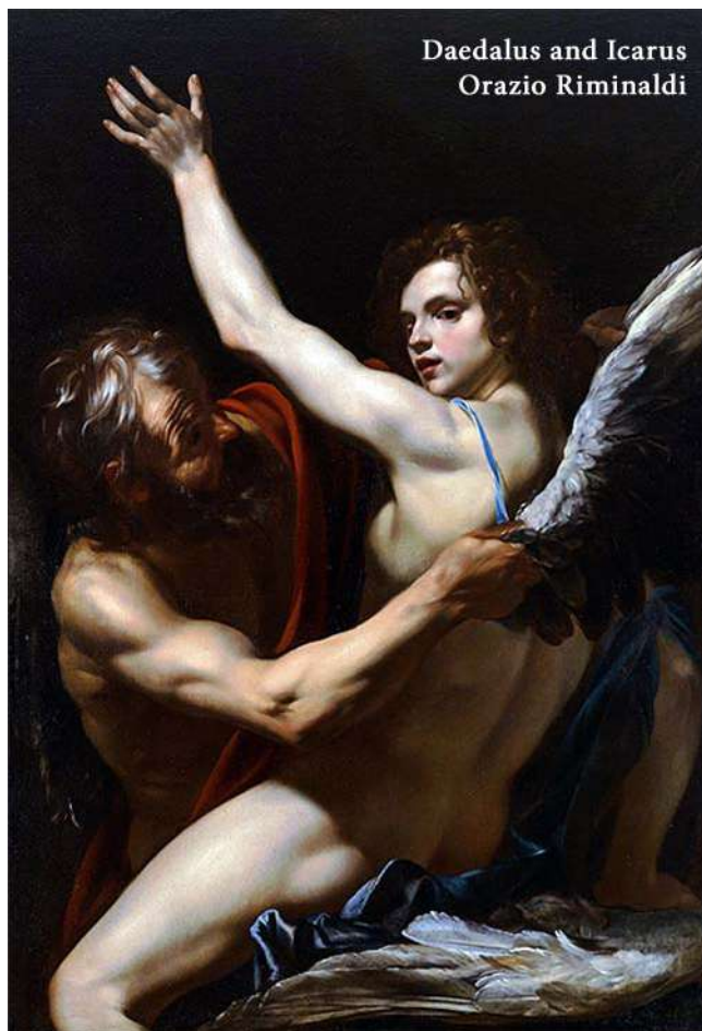
Daedalus and Icarus Orazio Riminaldi

i dochovaná čelenka z peří posvátného ptáka quetzala, která snad patřila poslednímu aztéckému vládcí Montezumovi.