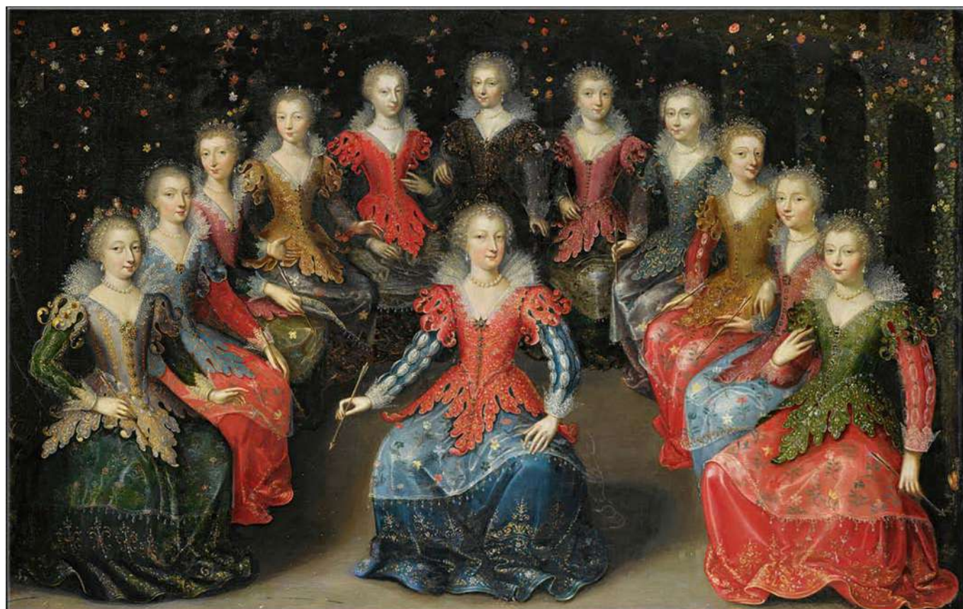
An Allegory Of Love, Claude Deruet