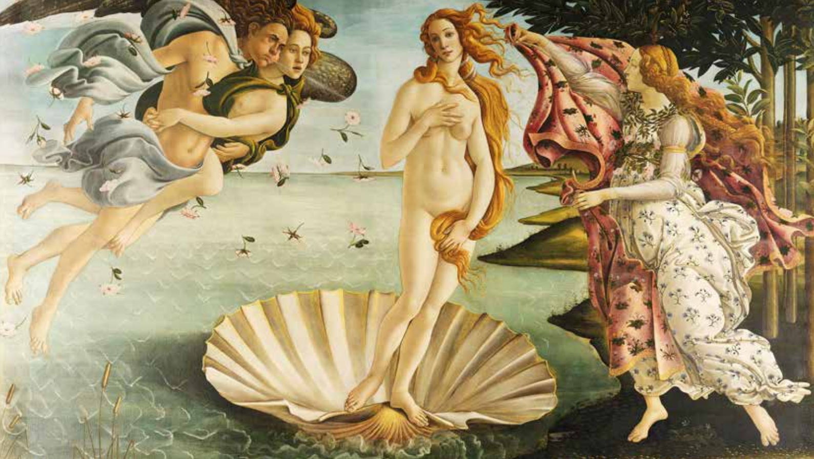
Сандро Боттічеллі. Народження Венери. 1485 р.

народжені їхнім життєдайним диханням, з іншого боку, богиня весни Ора та гірлянда троянд на її сукні – як символ можливості зустрічі Неба і Землі.