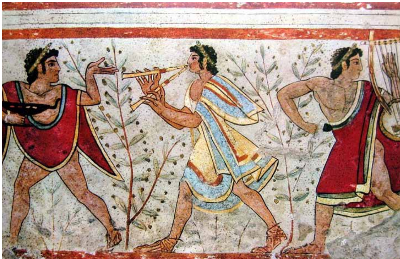
Музиканти і танцюристи (фрагмент розпису гробниці «Левів»). Етруски. VI ст. до н.е.

його одноманітність та монотонність порушуються періодами святкового релігійного часу, який дозволяє людині відновити спогади про духовні джерела світу і свої власні.