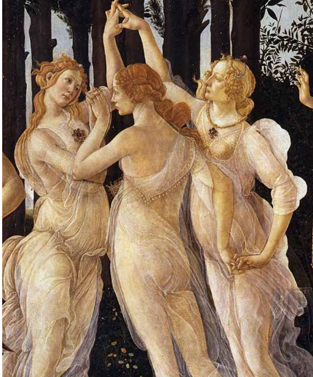
Сандро Боттічеллі. Весна (фрагмент). 1482 р.

ми бажаннями. На думку містиків епохи Відродження, тільки чиста любов дозволяє по-справжньому насолоджуватися красою. Ця Грація відрізняється від двох інших відсутністю будь-яких прикрас. Вона стоїть спиною до нас, і це означає, що досягнути божественного можливо, тільки якщо відсторонитися від цього світу заради споглядання іншого, священного світу.