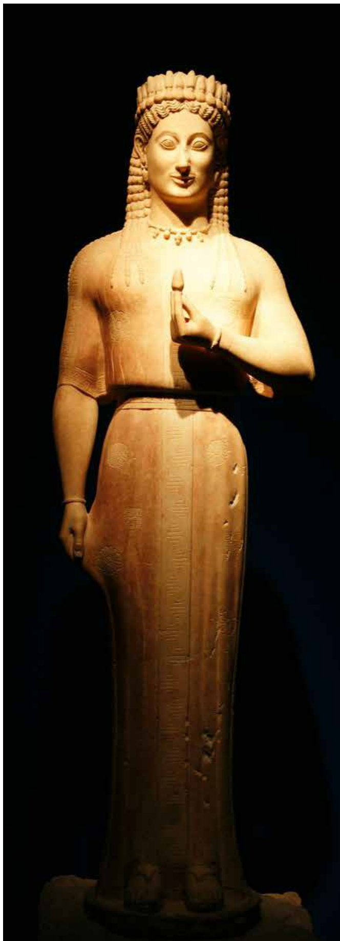
Кора. Стародавня Греція. 660–480 р.р. до н.е.

вгих випробувань і сходження в Аїд здобуває право на вічне небесне життя.