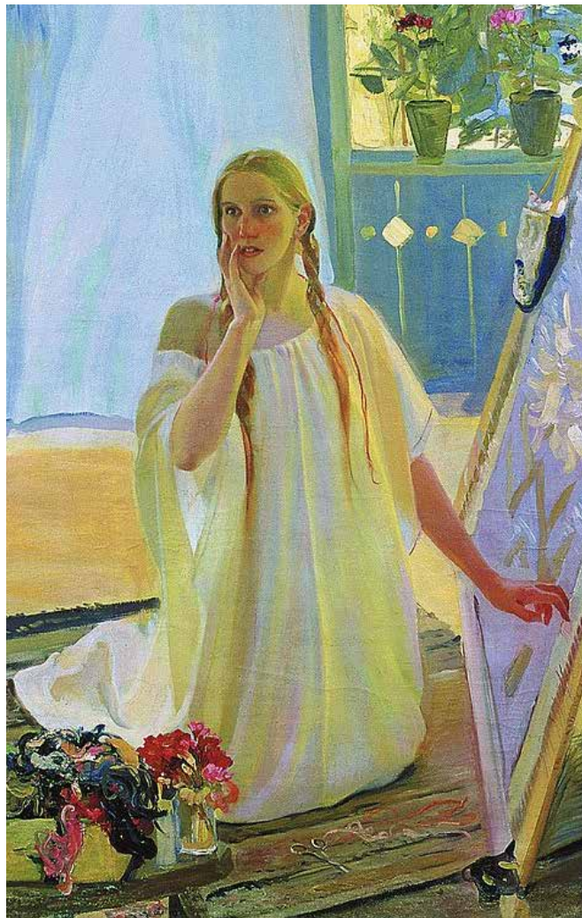
О. Мурашко. Благовіщення (фрагмент). 1909 р.

Усередині кожного з нас є своє небо і ясна сонячна дорога, шлях внутрішньої трансформації.