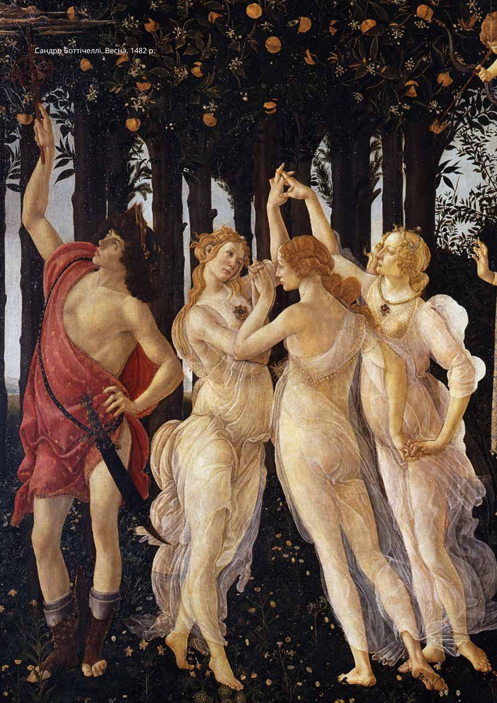
Сандро Боттичеллі. Весна. 1482 р.