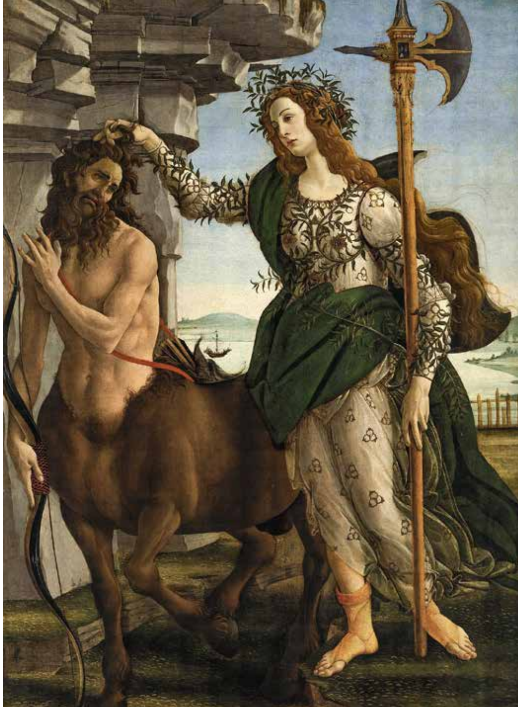
Сандро Боттічеллі. Паллада і Кентавр (фрагмент). 1482 р.

Кентавр знаходиться біля скелі, що нагадує про важкість матерії в найщільнішому її прояві – у формі мінералу; водночас Мінерва зображена у просторі з відкритим небом. Мінерва тримає Кентавра за волосся, тобто за голову, підкреслюючи, що саме розум-мудрість може подолати подвійність людської природи. Подібно до Меркурієвого кадуцея, алебарда Мінерви спрямована вертикально вгору і вказує на небесні сфери, до яких прагне філософ.