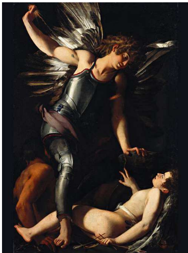
The Divine Eros Defeats The Earthly Eros, Giovanni Baglione

To je jeden z nejzávažnějších problémů, které nám přináší současné jazyky, neboť se staly velmi chudými v mnoha vnitřních aspektech, přestože jsou velmi bohaté v pojmenování všeho technického, všeho materiálního, všeho vědeckého. Jsou velmi chudé na to, aby se ponořily do hlubin lidské bytosti. Ve starověkých jazycích pro vyjádření různých druhů lásky existovalo tolik slov, kolik v člověku existovalo různých citů nebo schopností milovat.