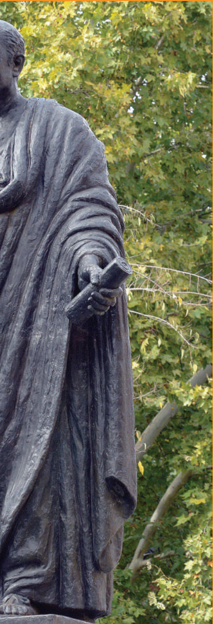
■ Séneca en Córdoba, La Puerta de Almodóvar.

Prefecto de la guardia pretoriana, en figura clave en el gobierno del imperio. Introducen importantes reformas fiscales y judiciales, constituyendo una de la épocas más justas de la historia de Roma y controlando los desmanes de Agripina y de Nerón. . En esta época escribe De constantia sapientis y De clementia . Pero cuando Nerón comienza a acaparar más poder personal.