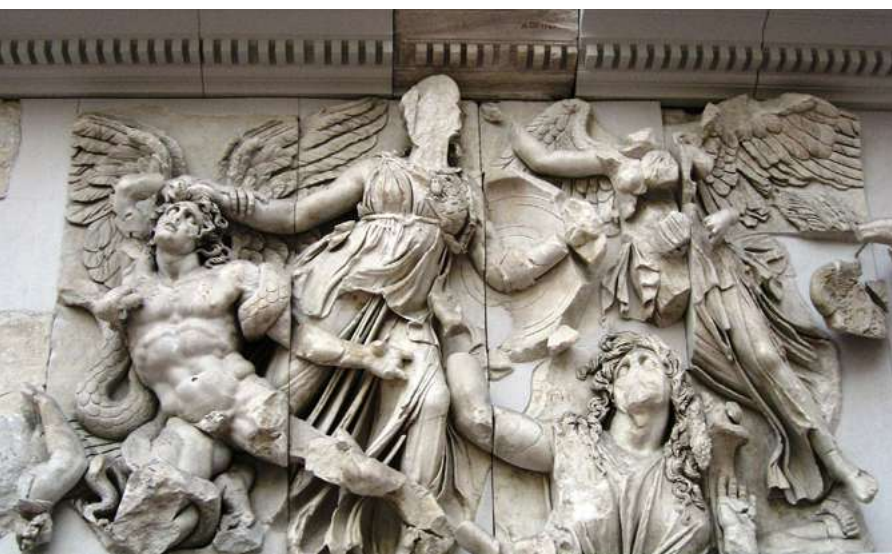
ATENA IN NIKE SE BORITA Z ALKIONEJEM (LEVO), GAJA SE DVIGA S TAL

Tu se Heraklej ob boku Olimpijcev bori z Giganti. V sredini dominira oče bogov Zevs s plapolajočim ogrinjalom, ki s svojo desnico nad sovražne gigante meče strele. Ob Heri vodi Zevsov voz boginja Iris. Atena trga Alkineja iz objema zemlje in pošilja proti njemu pogubno kačo. Njegova mati Gaja zama prosi za sinovo življenje.