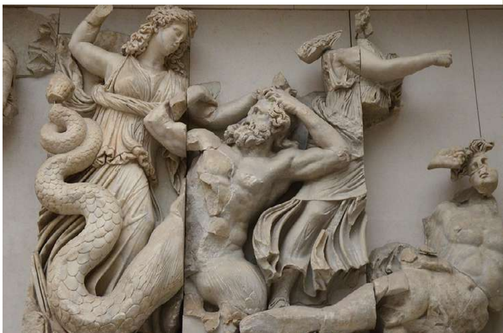
TRI MOJRE POBIJAJO GIGANTA AGRIJA IN TOA

Oltar je bil postavljen v čast vojaškim zmagam vladarjev Pergamona. Je mojstrovina helenističnega kiparstva, ki s svojim tridimenzionalnim učinkom in baročnim občutkom gibanja omogoči, da podobe pred očmi opazovalca oživijo. V globokem reliefu so prikazani dramatični prizori iz mitske Gigantomahije.