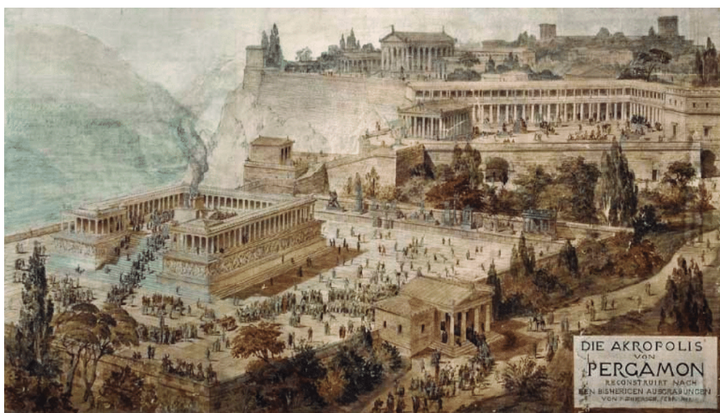
REKONSTRUKCIJA ZEVSOVEGA OLTARJA V PERGAMONU

Starodavna akropola leži na severozahodu Male Azije. 330 m visok hrib dominira nad planjavo, po kateri se vije reka Kaikos. Pergamon je dosegel vrhunec pod dinastijo Atalidov, naslednikov Aleksandra Velikega. Njihov razcvet se začne z vzponom kralja Atalosa I. Ta v letu 241 pr. n. št. premaga keltska plemena, ki so plenila po Anatoliji, obvaruje Pergamon in se vzpne na prestol. Pod njegovima sinovoma Eumenesom II. In Atalosom II. postane dinastija Atalidov ena najmočnejših v helenističnem svetu.