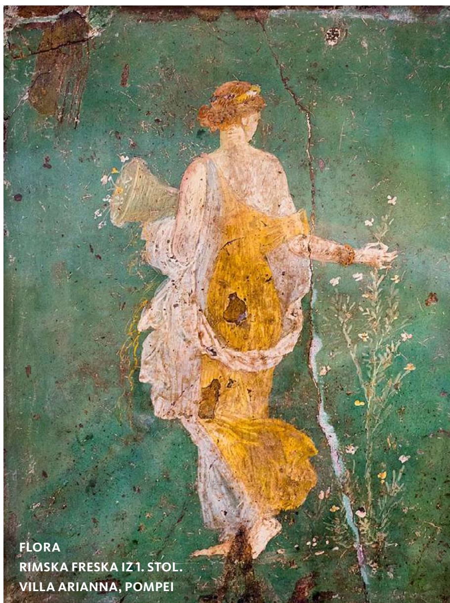
FLORA RIMSKA FRESKA IZ 1. STOL. VILLA ARIANNA, POMPEI