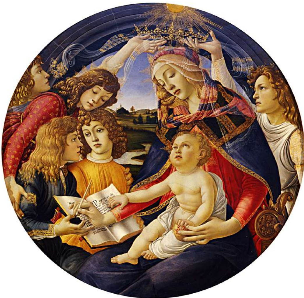
MARIJA MAGNIFIKAT, 1481

Genialnost umetnika je v tem, da začuti lepoto sveta in bitij, ki ga obdajajo, naslika nekaj, kar je še dlje od te vidne lepote in tako naredi ideal lepote, dostopen vsakomur.