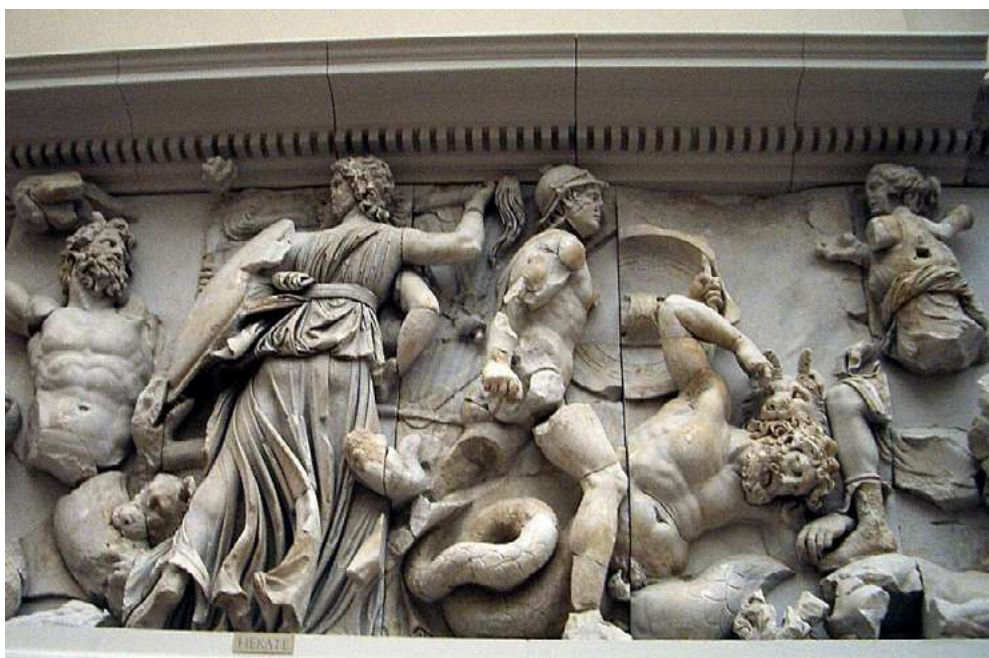
HEKATA SE BORI PROTI KLITIJU (LEVO); ARTEMIDA PROTI OTOSU (DESNO)

Na južni strani se proti Gigantom borijo zvezdna božanstva skupaj s titani, ki poveljujejo silam svetlobe in časa. Titanka Fojba proti Gigantu zamahuje z baklo in njena hči Asterija drugega prebada z mečem. Poleg njiju se bori Helios v kočiji, ki jo vlečejo štirje konji, Eos (boginja zarje) jaha na konju in zadaja udarec z baklo. Na levi strani se mlad bog bori z levjeglavim velikanom.