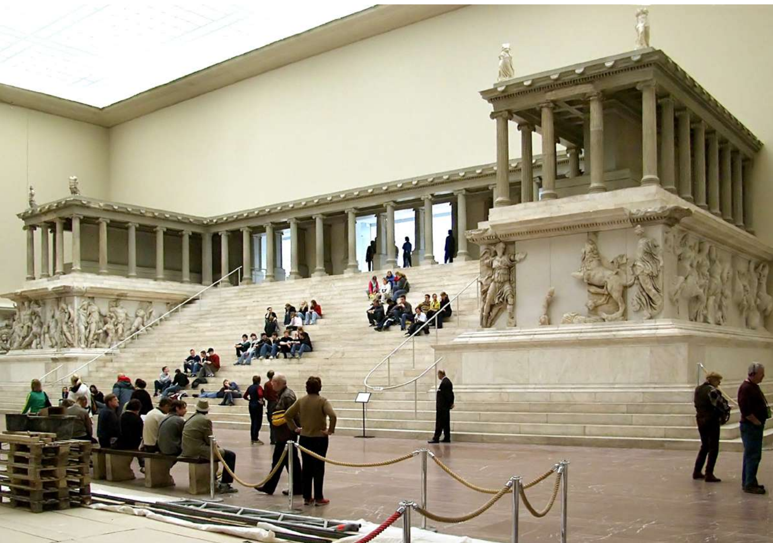
REKONSTRUKCIJA, MUZEJ PERGAMON, BERLIN