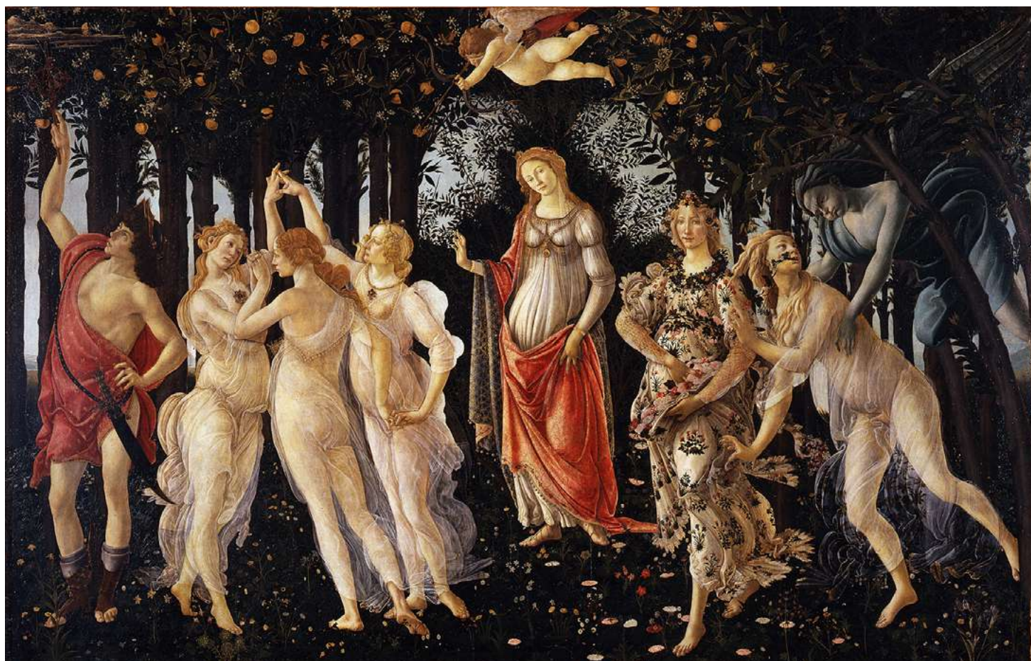
PRIMAVERA (OK. 1482), UPODOBITEV SPOMLADANSKE PRENOVE FLORENTINSKE RENESANSE.

Na ta način se je Botticelli skušal povzpeti do stanja, ko umetnik, ki slika z očmi duše in ne telesa, postane na neki način prerok božanskega. Umetnik, tako kot mag, poskrbi, da se v očeh ljudi skozi lepoto prikaže tisto duhovno. 🪄