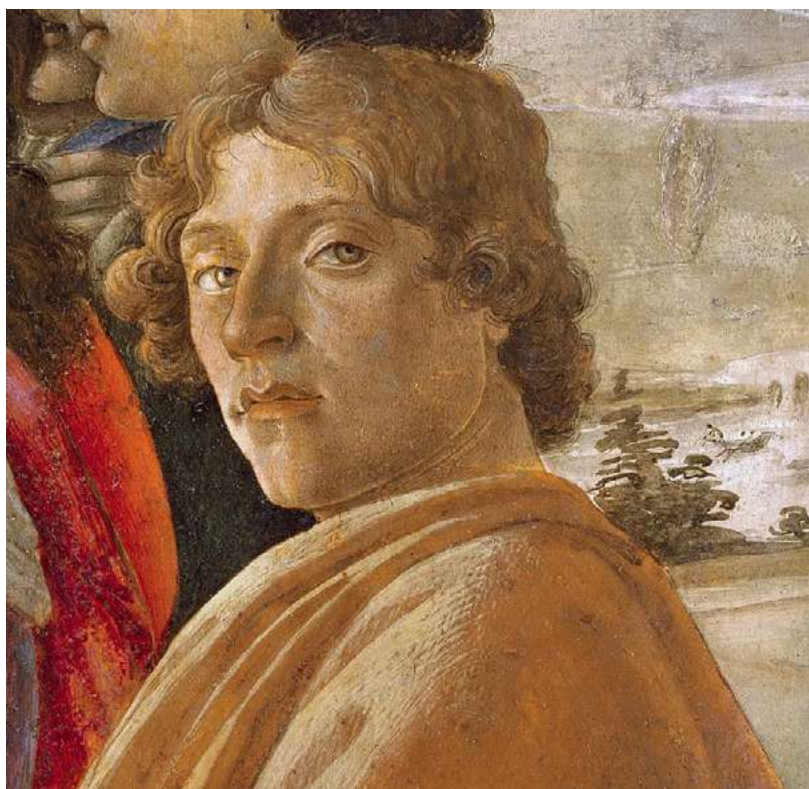
S. BOTTICELLI, AVTOPORTRET, DETAJL Z DELA POKLON SV. TREH KRALJEV

Botticelli je vse življenje preživel v Firencah, razen enega krajšega bivanja v Rimu okoli leta 1481, ko je na željo papeža Siksta IV. mojstrsko naslikal nekaj prizorov v Sikstinski kapeli. Okoli leta 1490 se je začel ukvarjati z ilustriranjem Dantejeve Božanske komedije , delom, ki ga je zaposlovalo vse do njegove smrti leta 1510.