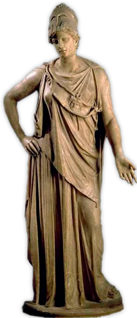
Atena – božica mudrosti u antičkoj Grčkoj

Čovjek u svakom trenutku mora odlučivati što će biti spomenik njegovom postojanju. Sve ovisi o našoj slobodnoj volji, izborima koje činimo i odgovornosti koju osjećamo prema životu. ☞