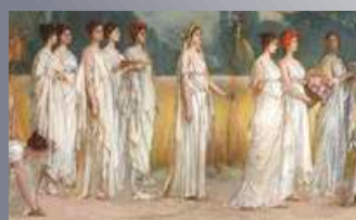
Proljetne svetkovine u Rimu