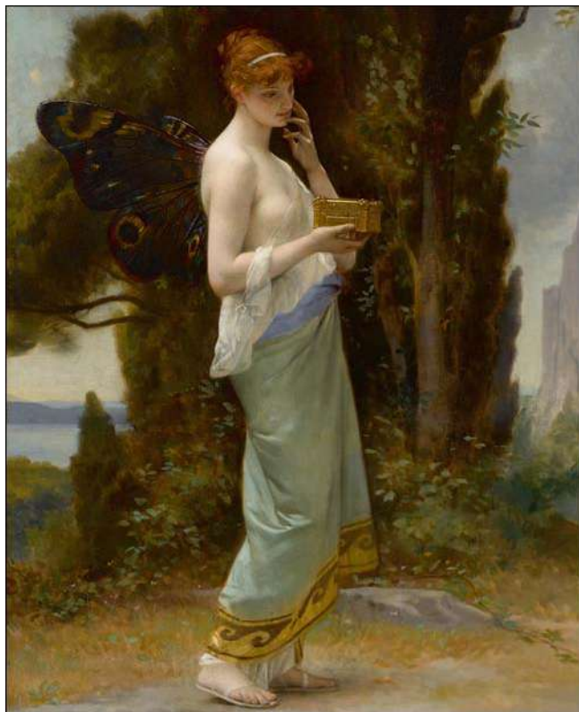
Psyché, Alexandre Cabanel

chický, mentální, morální a duchovní rozvoj těch, kteří později budou muset dát to nejlepší ze sebe, když se nejprve oni sami stanou lepšími.