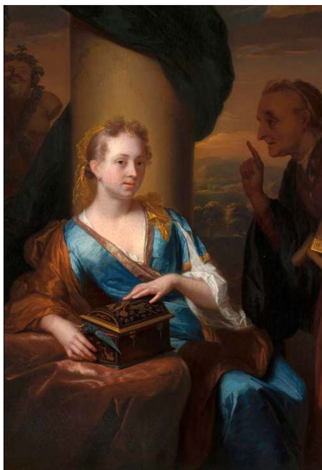
Zbytečná lekce morálky, Godfried Schalcken