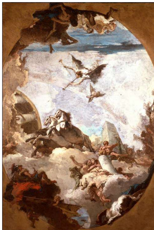
Herkulův triumf, Giovanni Battista Tiepolo