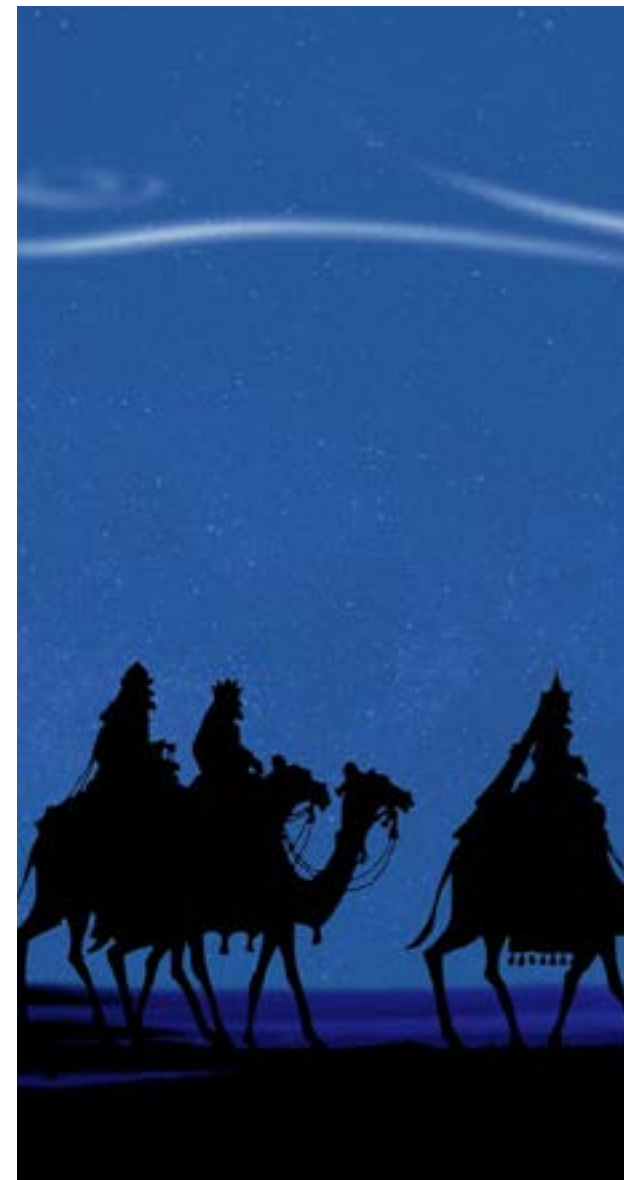
Figura 1: “Reyes Magos”.

Cuando llegan los magos a su tierra, deciden someter el pañal a la prueba de fuego y en el curso de una de sus ceremonias lo arrojan a la hoguera, para comprobar que no se había consumido, sino que permanecía entero, por lo que lo conservaron como una reliquia que se estuvo venerando primero en Bizancio y después en Francia, hasta que la revolución la destruyó. En verdad, no estaban descaminados aquellos doctos astrónomos, según pudo averiguar Kepler en 1604, cuando descubrió que en torno al 1 de marzo del año 7 antes de la era cristiana se había producido una conjunción de Júpiter y Saturno, junto al Sol, Luna y Venus.