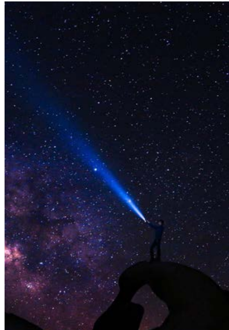
Figura 4: "Constelaciones".