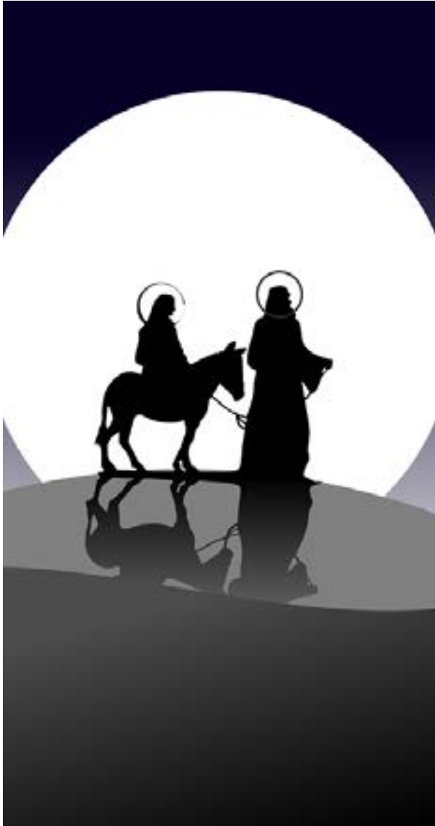
Figura 2: "Navidad / Estrella".

Situados en el signo de Piscis en ascendente, lo que potenciaba la conjunción, que habría durado hasta el 7 de julio. Por aquella fecha también se había producido el paso de un cometa brillante, lo cual explica las alusiones de los textos a la presencia de estrellas en las escenas de la Navidad.