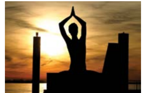
Figura 3: “Meditación”.