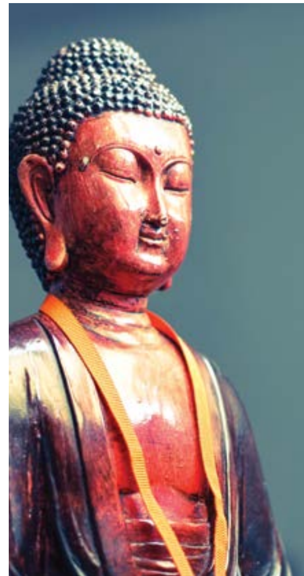
Figura 1: “Meditación Oriental”.

Pero un mundo y otro han caído en extremos peligrosos que, por una puerta u otra, han dejado paso a un materialismo venenoso.