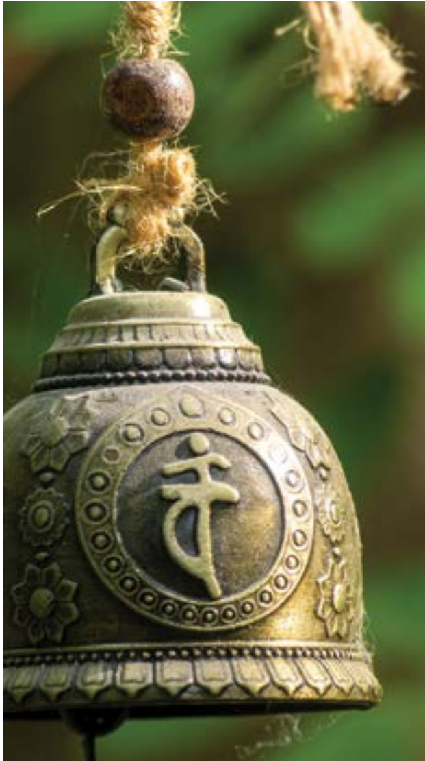
Figura 2: “Campana Oriental”.

El exceso de tecnificación ha vuelto los ojos del hombre exclusivamente hacia la tierra, y le ha hecho perder los horizontes del espíritu que, justamente por espirituales, no se pueden imbricar en la lógica de las máquinas.