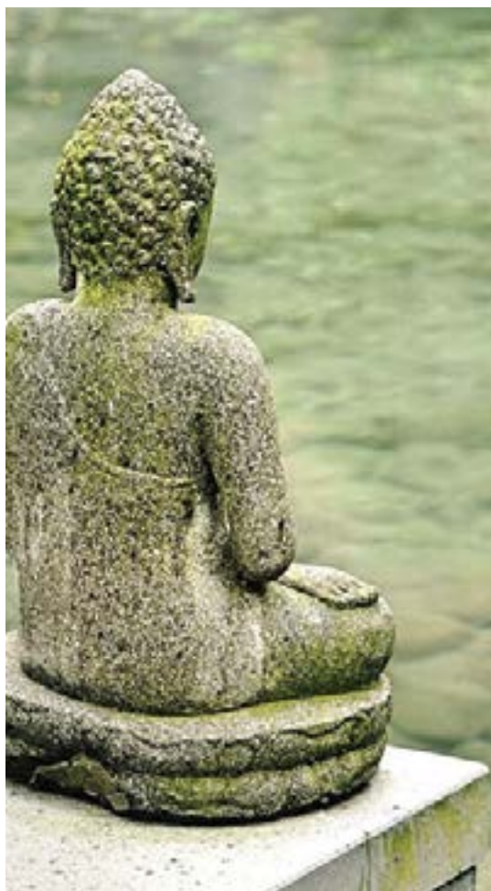
Figura 1: "Buda".