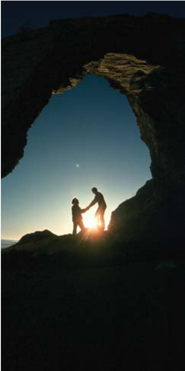
Figura 4: "Puesta de Sol".

Más vale un compromiso consciente que una pseudolibertad inconsciente. La segunda, tarde o temprano se convierte en una cárcel de la que uno no puede evadirse. El compromiso es un cauce para canalizar la corriente del río de nuestras vidas. Seamos libres: sepamos elegir, sepamos asumir nuestros compromisos con alegría y confianza en nosotros mismos. Así lo hicieron todos los grandes Maestros que hoy señalan calladamente el rumbo que ha de seguir la Humanidad.