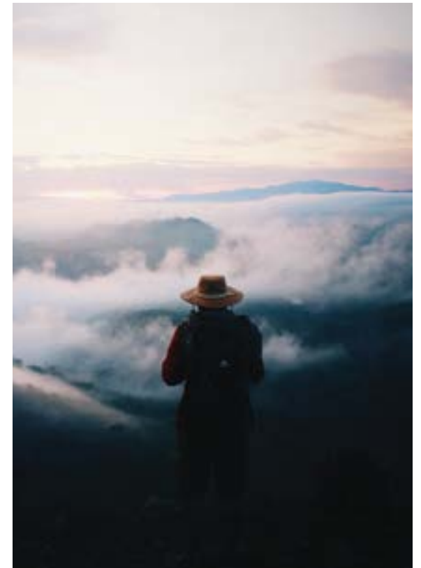
Figura 2: “Aire Libre”.