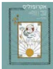
עיצוב השער: שירה משולם חזקיה, ענבל בורד

עורכת העיתון: עפרה בהרב עורכת משנה: אסנת ליפסון עיצוב גרפי והפקה: עפרה בהרב, ענבל בורד, ליטל כספין, שירה משולם חזקיה עריכה לשונית והגהה: יסמין פיאמנטה שמיר, יפעת קלוגר עיתון אקרופוליס החדשה, עמותה ללא מטרות רווח מספר 0-144-012-58 רשיון עמותה מספר 5222 כתובת דואר אלקטרוני של המערכת: magazine@newacropolis.org.il תוכן המאמרים והמודעות בעיתון על דעת הכותבים ועל אחריותם בלבד והתמונות מארכיון אקרופוליס החדשה. www.newacropolis.org.il