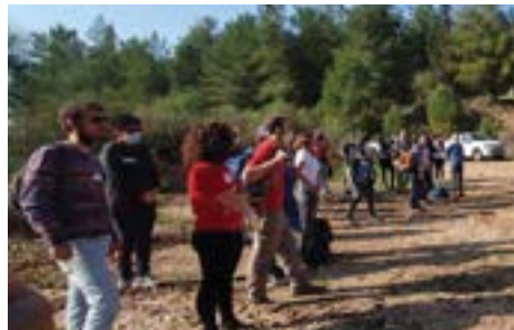
פעילות ניקיון ביער בן שמן