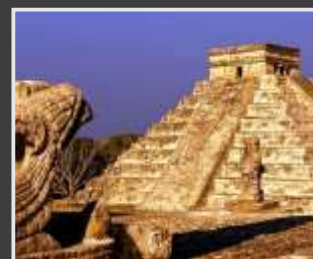
Grandes oportunidades: el ejemplo azteca