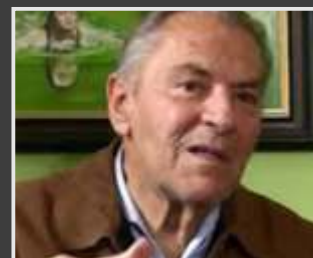
La memoria del nacimiento