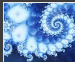
Fractales: orden en el caos