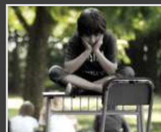
Educación prohibida, educación necesaria